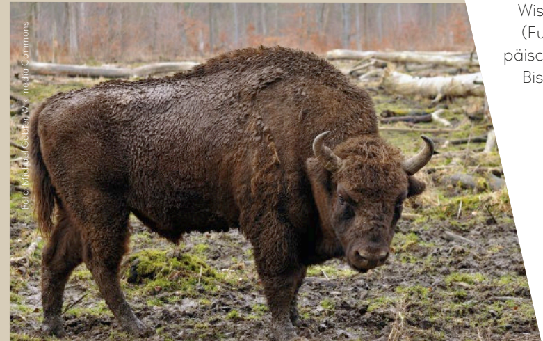
Wisent (Euro- päischer Bison)

Wisentgehege erleben. Darüber hinaus findet man Schweine als Symbol auf Aufklebern und Taschen und seit 2011 als bunte Stadtfiguren auf dem Weg von der Völkseener Straße zum Oberntor. Sie dienen der Imagepflege und muntern jeden Gast mit dem vielsagenden Gruß auf: „Mensch, da habt Ihr ja richtig Schwein gehabt.“